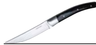
043.05.542 μαχαίρι steak, 23 cm