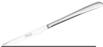
043.05.205 μαχαίρι steak «Universal», 24 cm