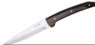
043.05.541 μαχαίρι steak 23 cm