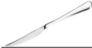
043.08.001 μαχαίρι steak 22 cm