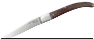
043.05.545 μαχαίρι steak καφέ ήλαβη τύπου laguiole, 23,9 cm