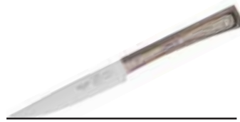
043.05.518 μαχαίρι steak, 26 cm