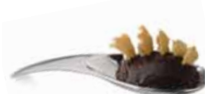
043.05.022 κουτάλη ορεκτικών Zakouski