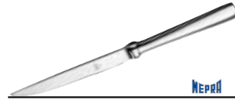
043.02.139 μαχαίρι steak «Uni», 21,3 cm