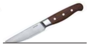
043.05.548 μαχαίρι steak, 25 cm