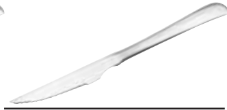
043.05.000 μαχαίρι steak «Portofino», 22,4 cm