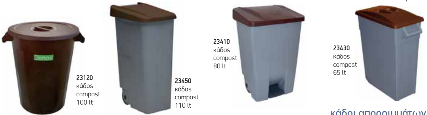
23120 κάδος compost 100 lt