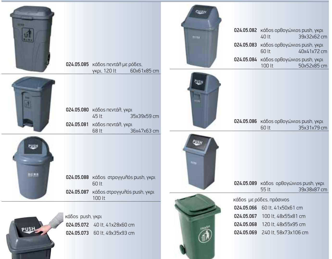
024.05.085 κάδος πεντάλι με ρόδες, γκρι, 120 lt 60x61x85 cm