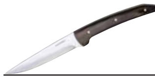
043.05.541 μαχαίρι steak 23 cm