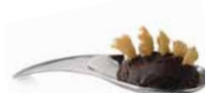
043.05.022 κουτάλι ορεκτικών Zakouski