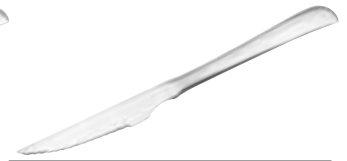
043.05.000 μαχαίρι steak «Portofino», 22,4 cm