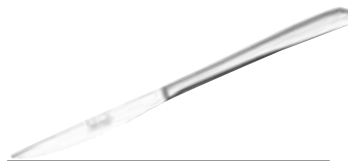
043.05.205 μαχαίρι steak «Universal», 24 cm