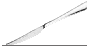
043.08.001 μαχαίρι steak 22 cm