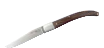
043.05.545 μαχαίρι steak καφέ λαβή τύπου laguiole, 23,9 cm