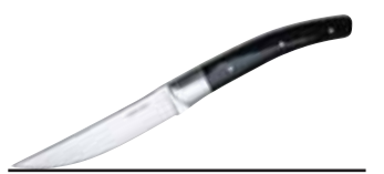
043.05.542 μαχαίρι steak, 23 cm